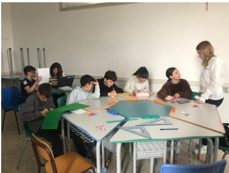
Istituto Comprensivo di Santa Maria della Versa_fase II