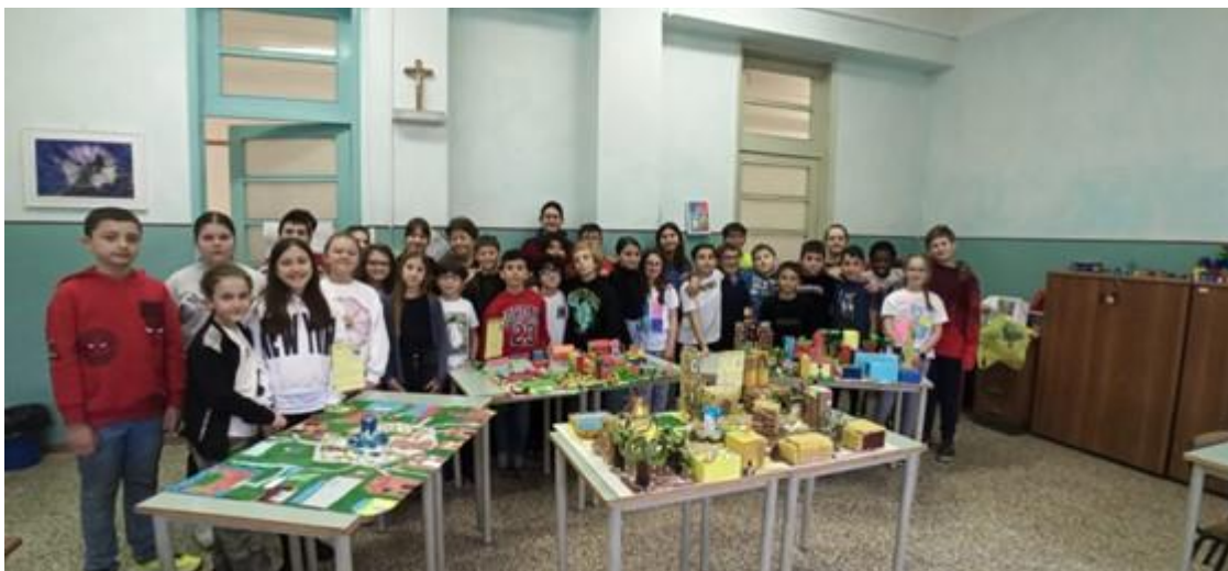
Istituto Comprensivo di Casteggio fase III