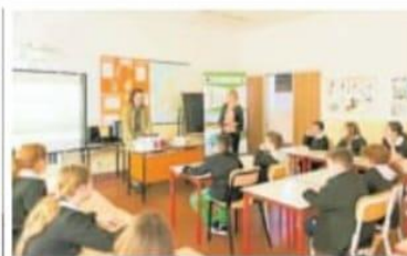
Il laboratorio svolto dal Gal Oltrepo in una classe di Ponte Nizza

tercettare bisogni e punti di vista, contribuendo a definire le strategie di sviluppo locale. Bambini e ragazzi, dopo una breve presentazione, sono stati invitati a confrontarsi tra loro e con il corpo insegnante per costruire il proprio boego ideale, il paese in cui vogliono vivere oggi e che sarà la loro residenza di domani. Sfruttando carta, forbici, materiali di ricic-