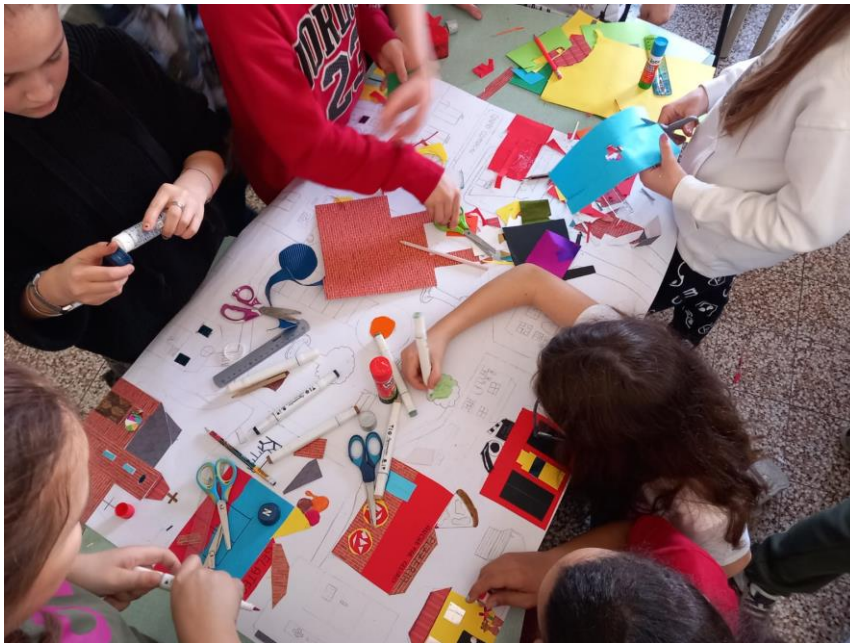
Istituto Comprensivo di Casteggio fase II