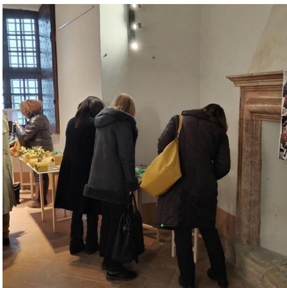
Esposizione dei lavori al Castello di Zavattarello