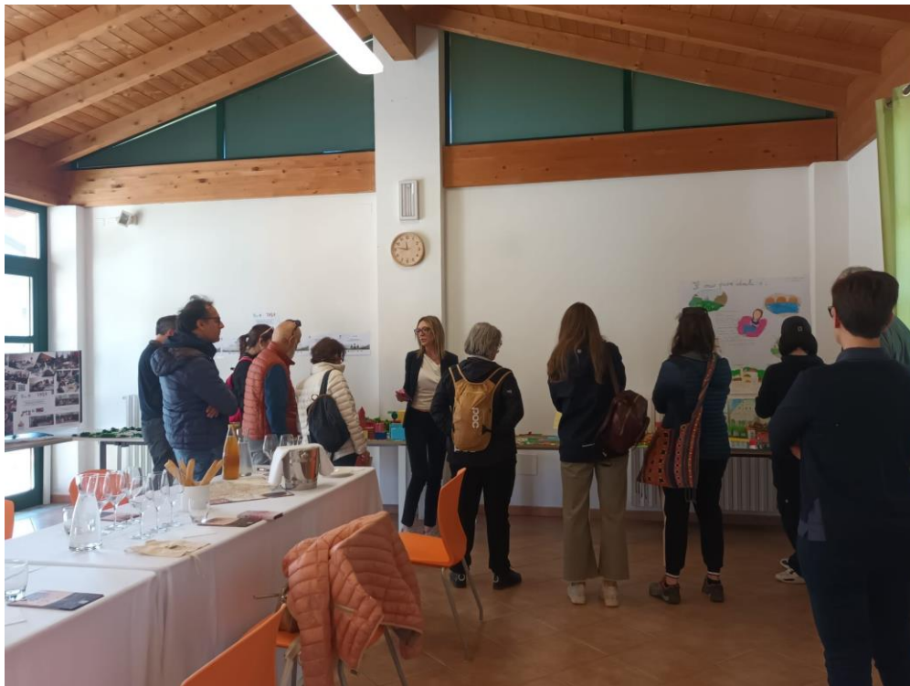
Presentazione dei lavori esposti a Ponte Nizza, ai giornalisti di stampa nazionale durante il Press Tour in Oltrepò Pavese