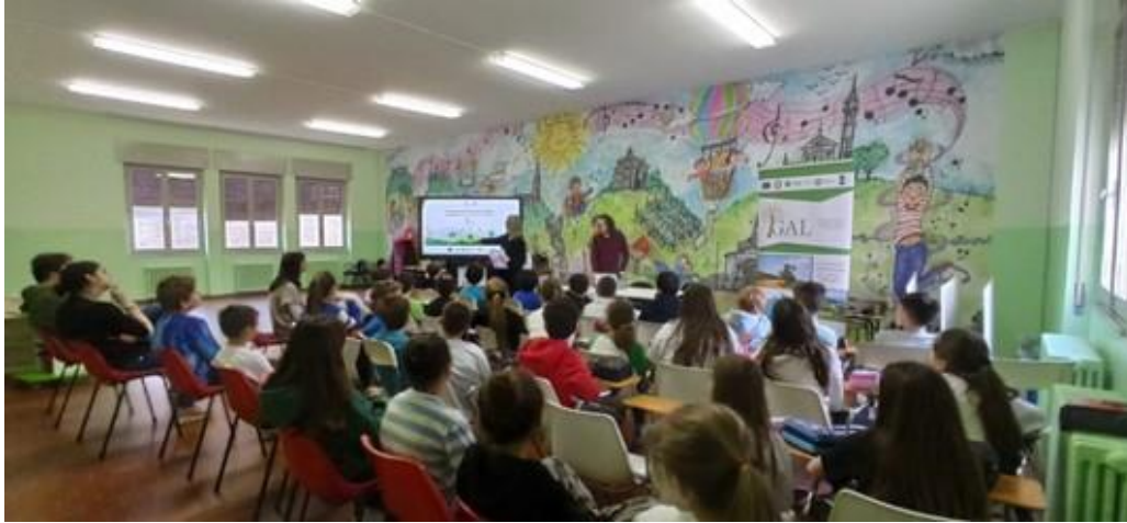
Istituto Comprensivo di Casteggio fase I