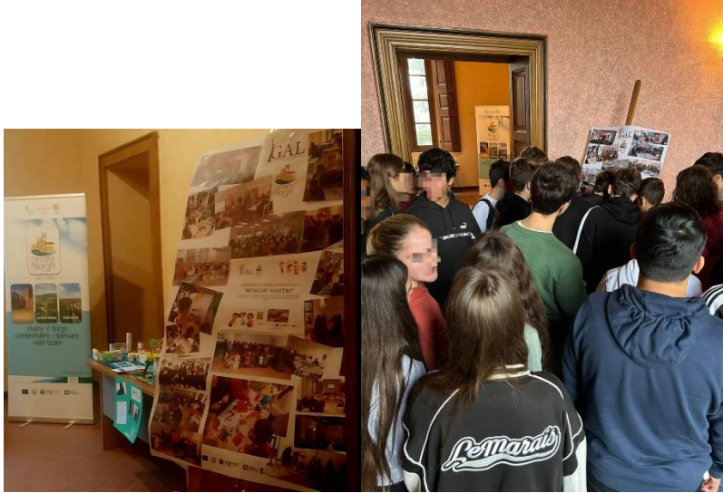
Esposizione al Museo Archeologico di Casteggio