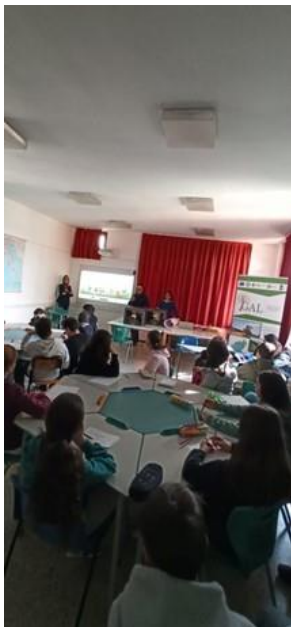
Istituto Comprensivo di Santa Maria della Versa_fase I