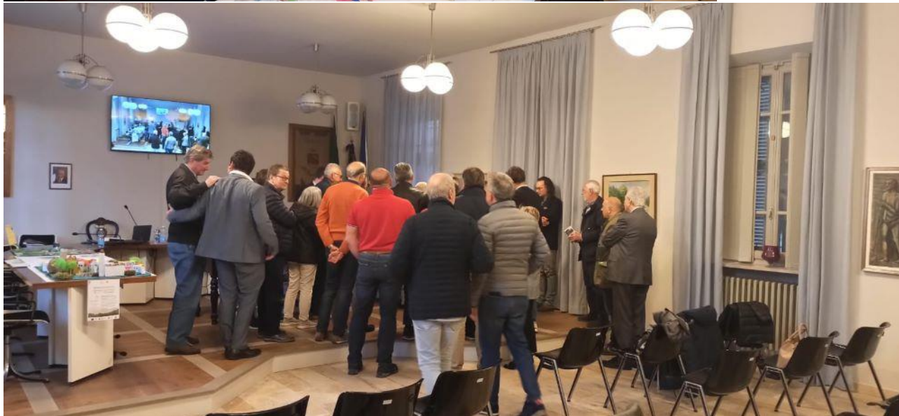
Presentazione dei lavori delle scuole ai Sindaci del territorio